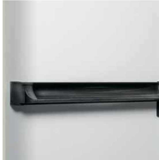
IDRA porta tagliafuoco in acciaio grigio pre-verniciato