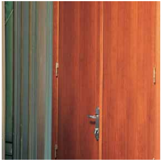
AIDA porta in legno tagliafuoco Opera in ciliegio tinto