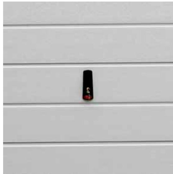
STAVE white up and over door