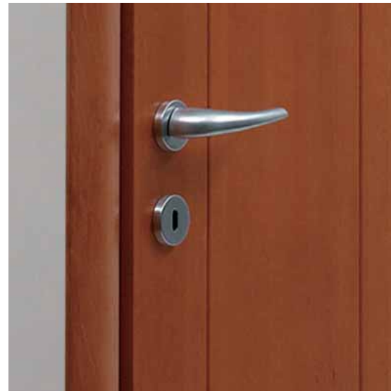
PARODI versione cieca in ciliegio