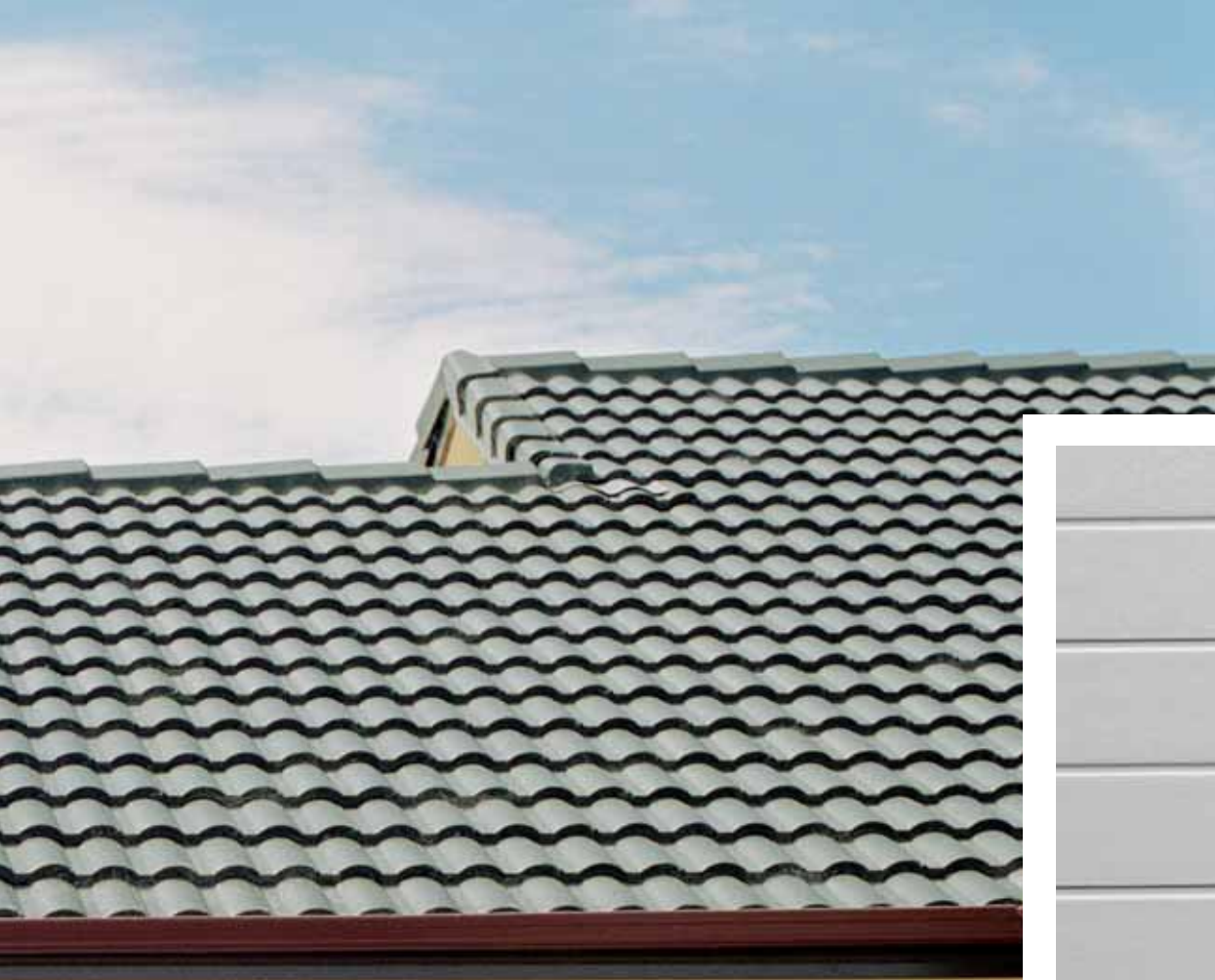
STAVE portone basculante colore bianco