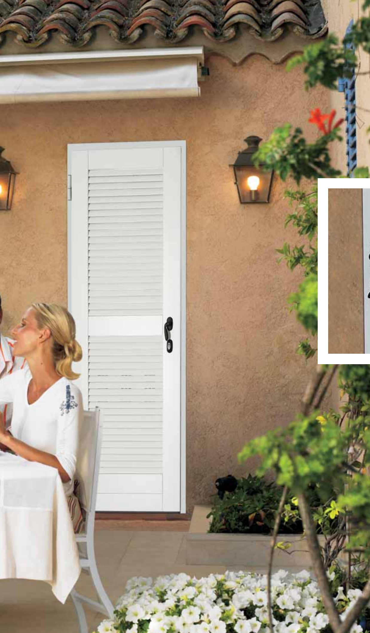
ANTHEA porta finestra a doppio battente laccato bianco