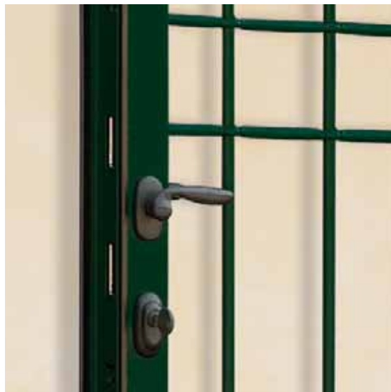
GRATA SNODATA LACCATA VERDE