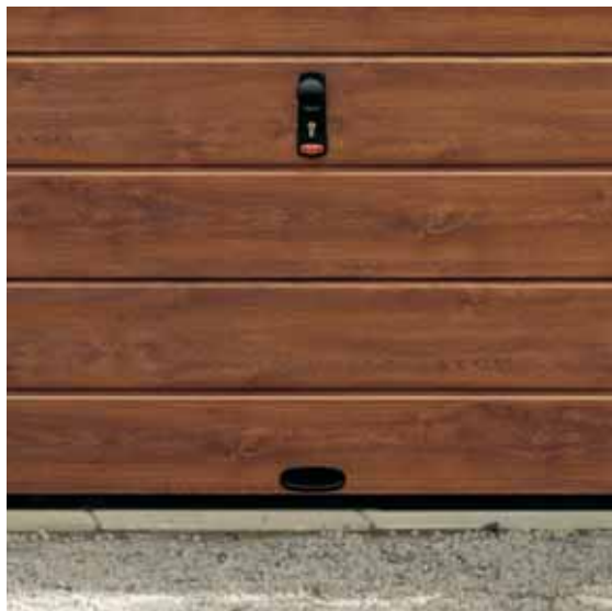
FREEBOX LINEAR DL sezionale goffrato legno simil legno