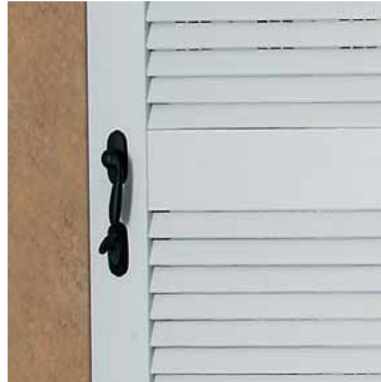
ANTHEA double leaf French door lacquered white