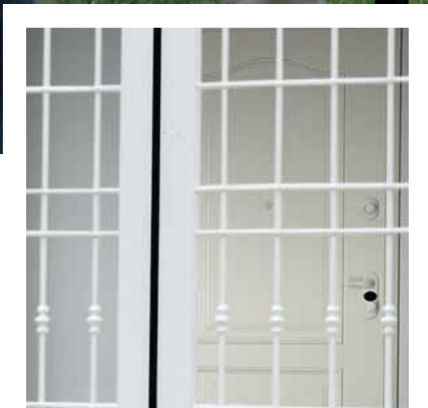
SPACE MONO Greta porta finestra scorrevole a due ante laccata bianca