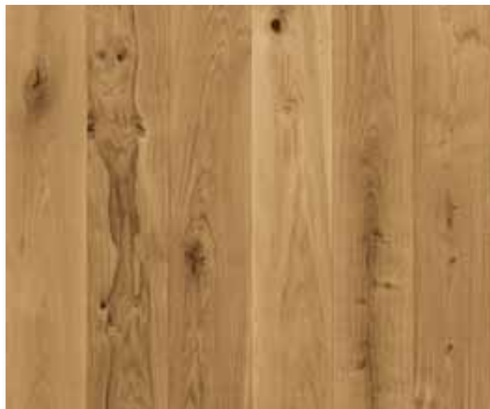
XILO1934 | NATURALE

Note: per maggiori informazioni si veda catalogo generale: finiture pag. 35, scelte pag. 40-42, manutenzione pag. 49.