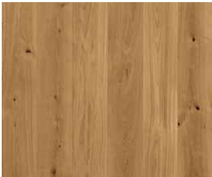
XILO1934 | CLASSICA