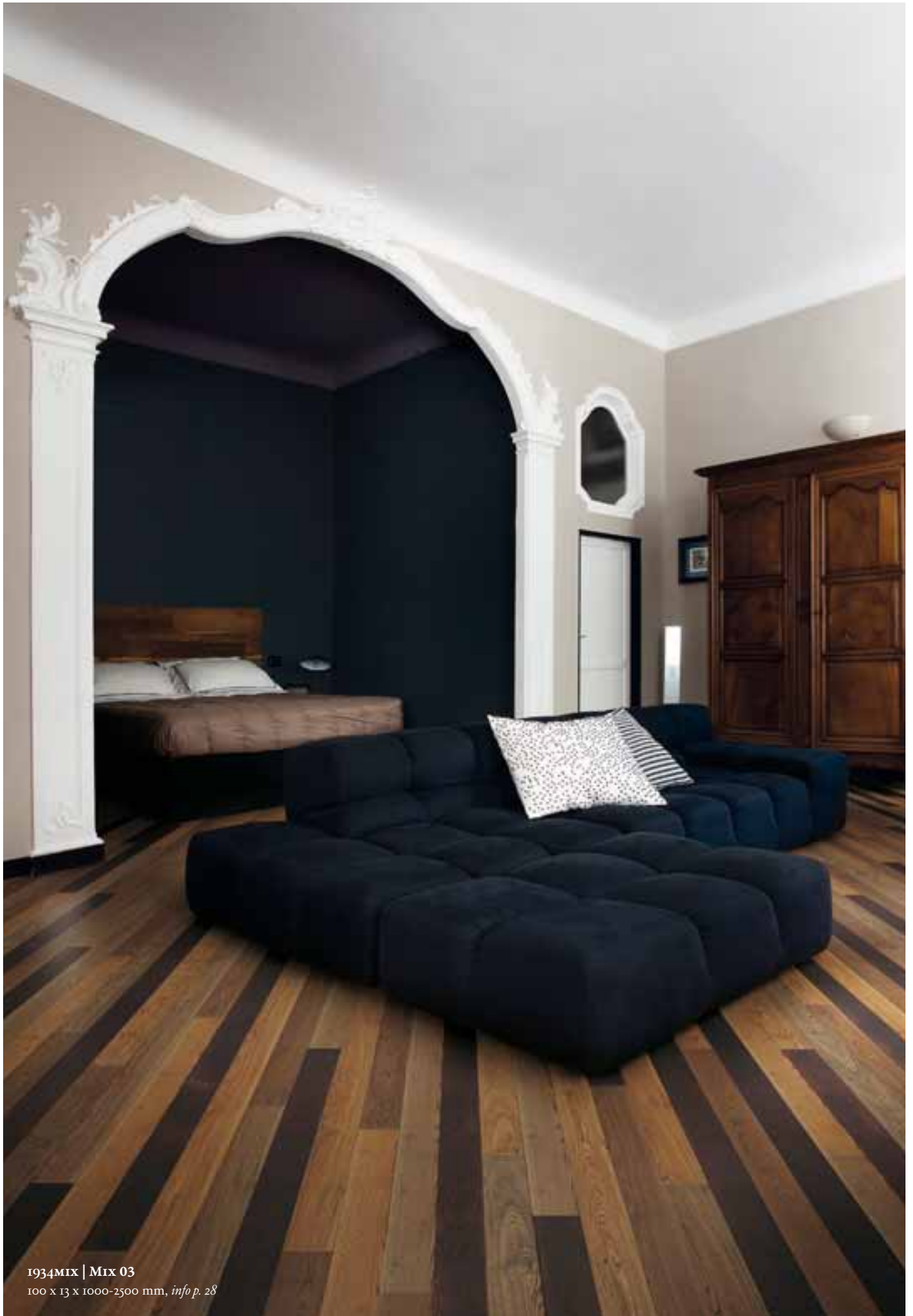
1934MIX | MIX 03 100 x 13 x 1000-2500 mm, info p. 28