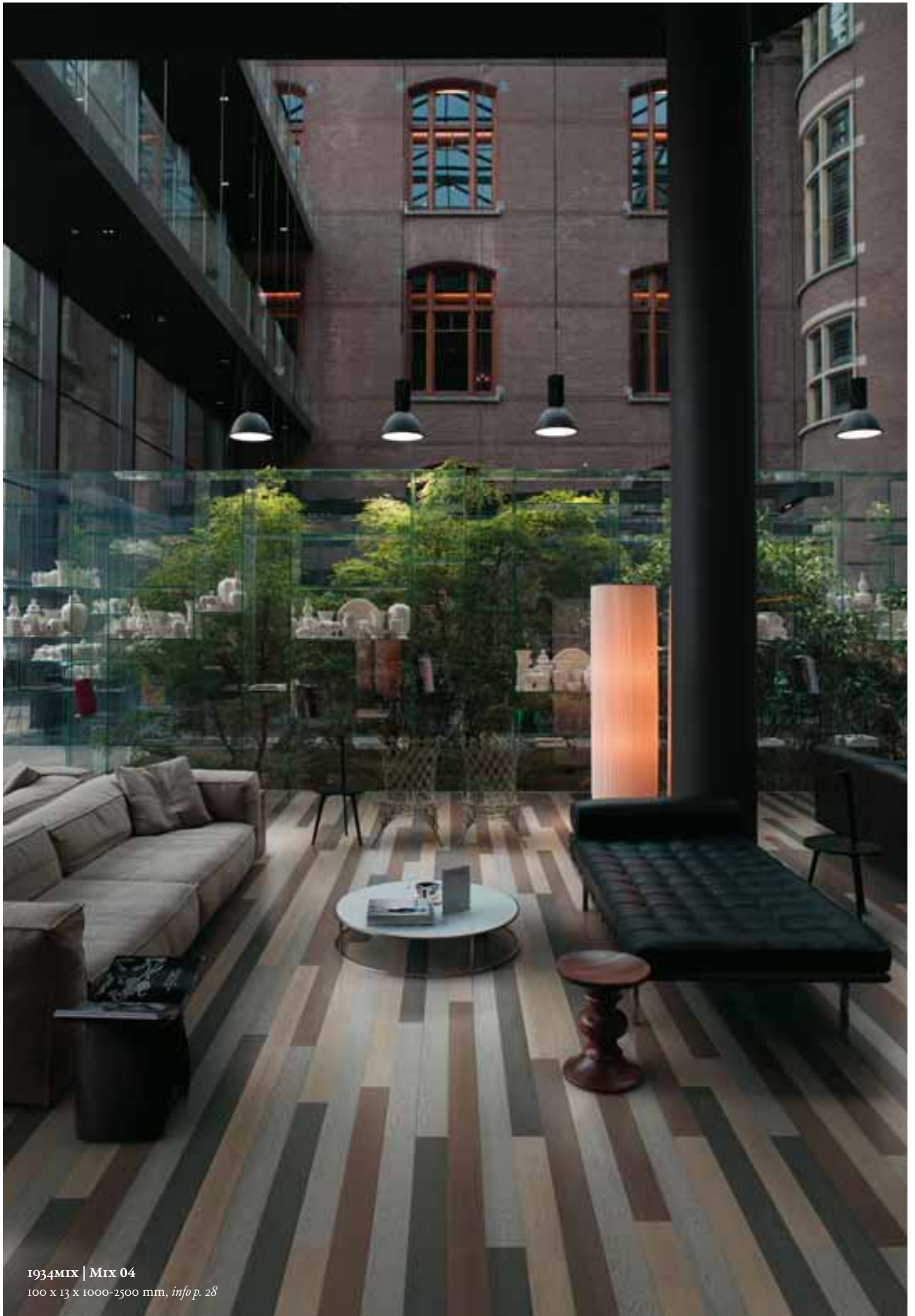
1934MIX | MIX 04 100 x 13 x 1000-2500 mm, info p. 28