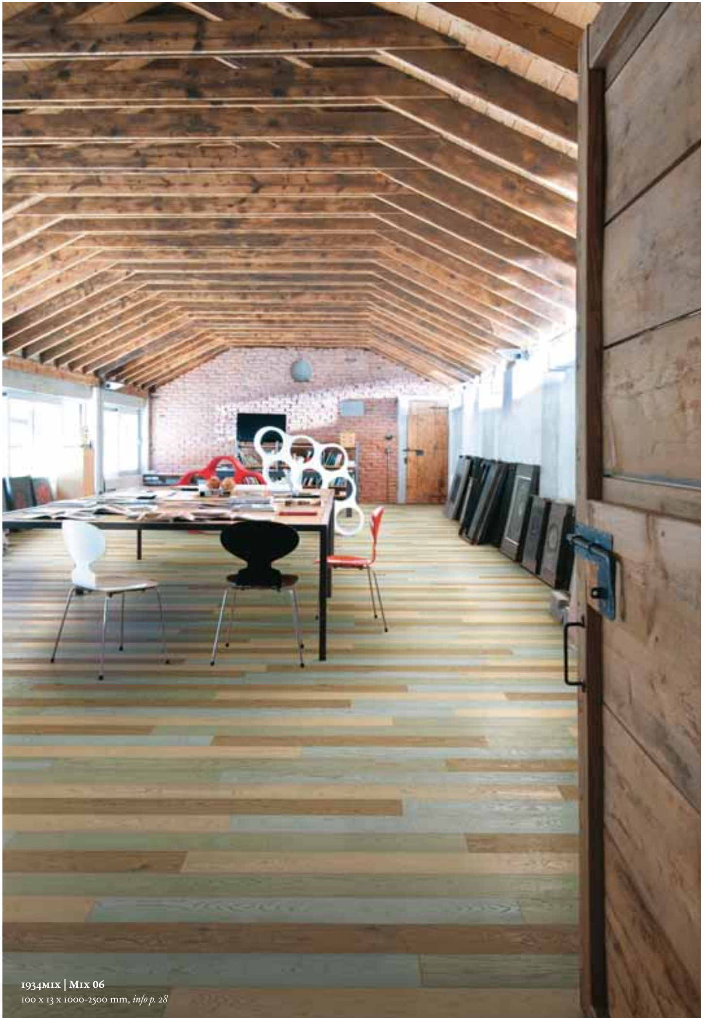
1934MIX | Mix 06 100 x 13 x 1000-2500 mm, info p. 28