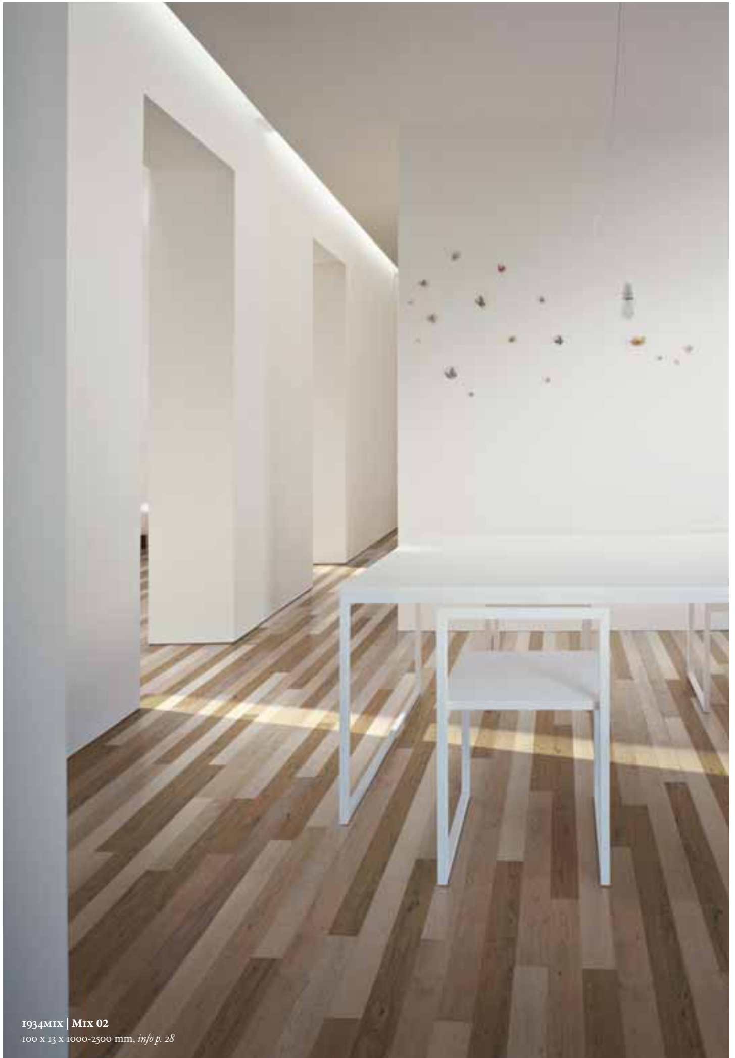
1934MIX | Mix 02 100 x 13 x 1000-2500 mm, info p. 28