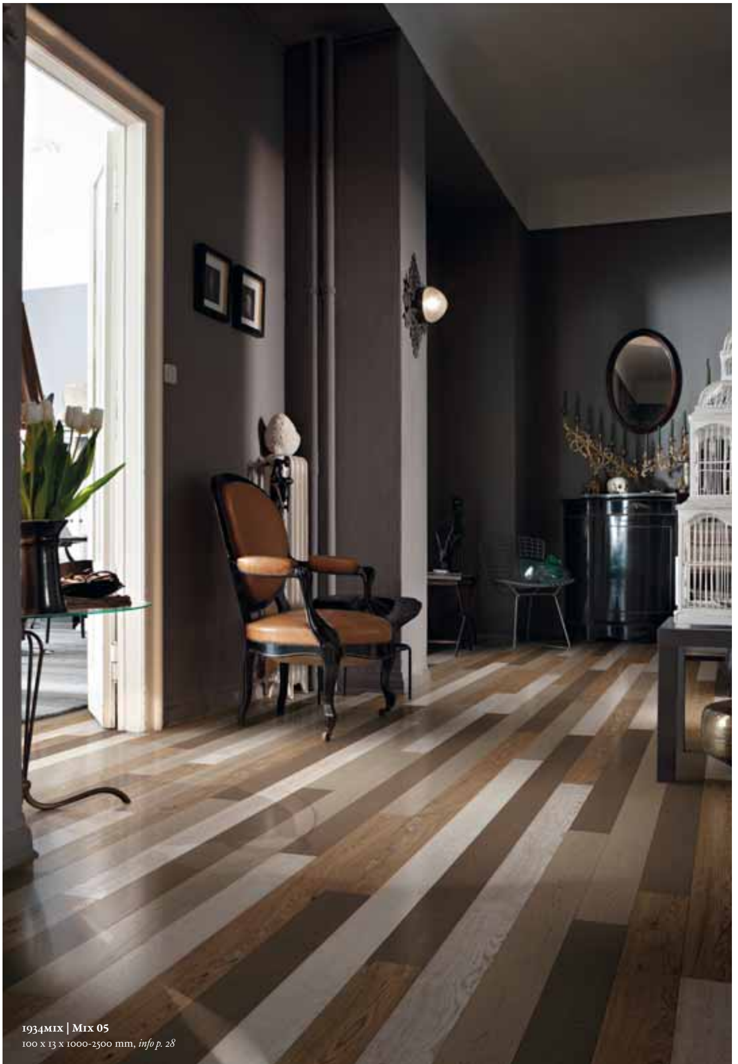
1934MIX | Mix 05 100 x 13 x 1000-2500 mm, info p. 28